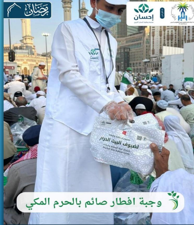
وجبة افطار صائم بالحرم المكي