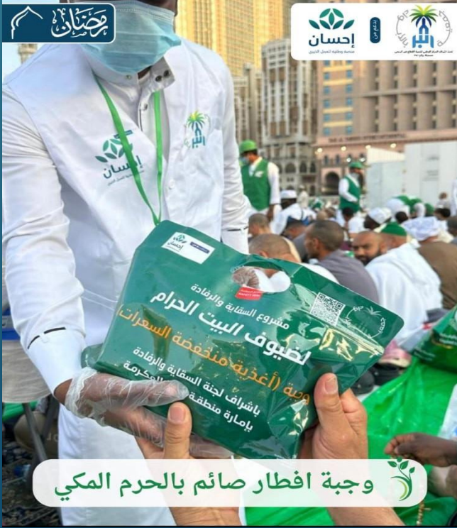
وجبة افطار صائم بالحرم المكي